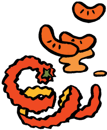
Une clémentine -----

Recopie les noms des aliments que Petit Poilu mange.