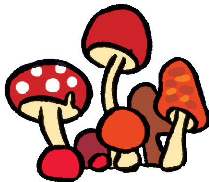
Des champignons -----