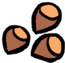
Des noisettes -----